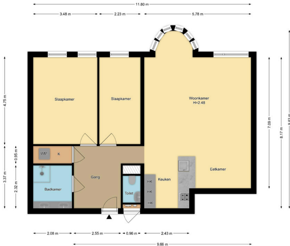
Appartement Dreef 2, Appartement 32, Haarlem

R.M. Vastgoedpresentatie Aan deze plattegrond kunnen geen rechten worden ontleend